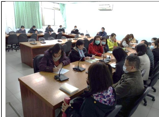
防疫小組及各科主任代表與會