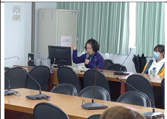
衛保組長防疫計畫業務內容報告