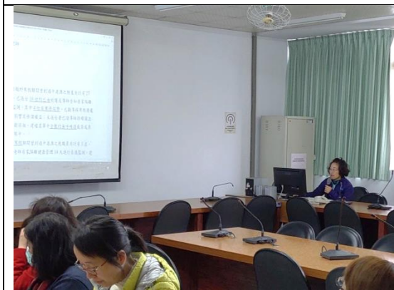
衛保組長防疫計畫業務內容報告